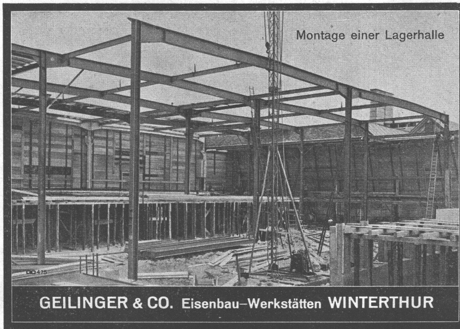
Montage einer Lagerhalle

GEILINGER & CO. Eisenbau-Werkstätten WINTERTHUR