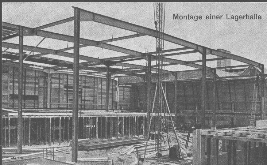
Montage einer Lagerhalle

Ständige Ausstellung unserer Erzeugnisse in der SCHWEIZER BAU-CENTRALE ZÜRICH, TALSTR. 9, BÜRSENBLOCK (Eintritt frei)