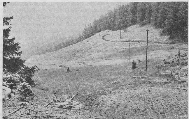
Abb. 1. Vermoortes Wiesland am Westhang ob Klosters (die Vermoorungsflächen entsprechen den dunklen Stellen). Aufnahme 5. Okt. 1945