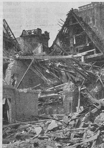
Abb. 4. Links neben dem stehengebliebenen Dachstuhlteil des Ostflügels das viereckige Mitteltürmchen, rechts das Münster