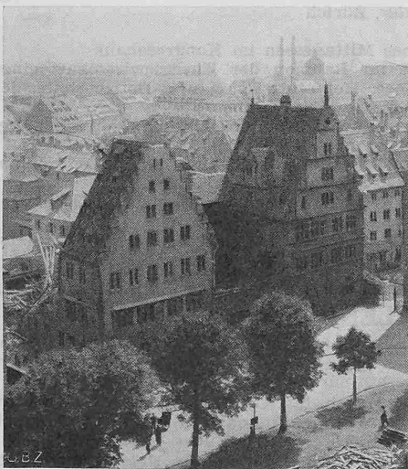
Abb. 3. Frauenhaus vom Münster aus gesehen: Ostflügel teilweise zerstört, Westflügel (mit Renaissancegiebel) erhalten

Der Bristol-«Centaurus»-Motor. In England ist nach einer Mitteilung in der «Aero-Revue», Nr. 10, Oktober 1945, während des Krieges ein Sternmotor von grosser Leistung entwickelt und, wie die Bristol Aeroplane Company Ltd. bekannt gibt, bis anfangs Mai 1945 bereits in 2500 Exemplaren ausgeführt worden. Diese als Bristol-«Centaurus»-Motor bezeichnete Maschine ist sowohl für die Zivilluftfahrt bestimmt, als auch für Kriegszwecke verwendet worden; sie wurde z. B. in die Hawker «Tempest II»-Jäger eingebaut, die 12,5 m Spannweite, 10,22 m Länge, 5000 kg Fluggewicht und 700 km/h Spitzengeschwin-