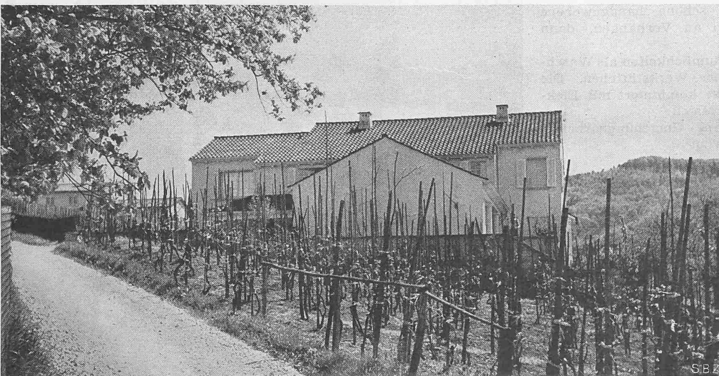
Abb. 4. Zufahrtstrasse und Nordseite des Hauses Dir. Dr. D. am Wartenberg

Die drei Wohnräume im Erdgeschoss (siehe Seiten 10 und 11) sind durch «Dämon» Schiebetüren verbunden, das Studio ist durch eine Glas-Schiebetüre vom Garten abgetrennt. Feste Rolläden sind dabei Voraussetzung.