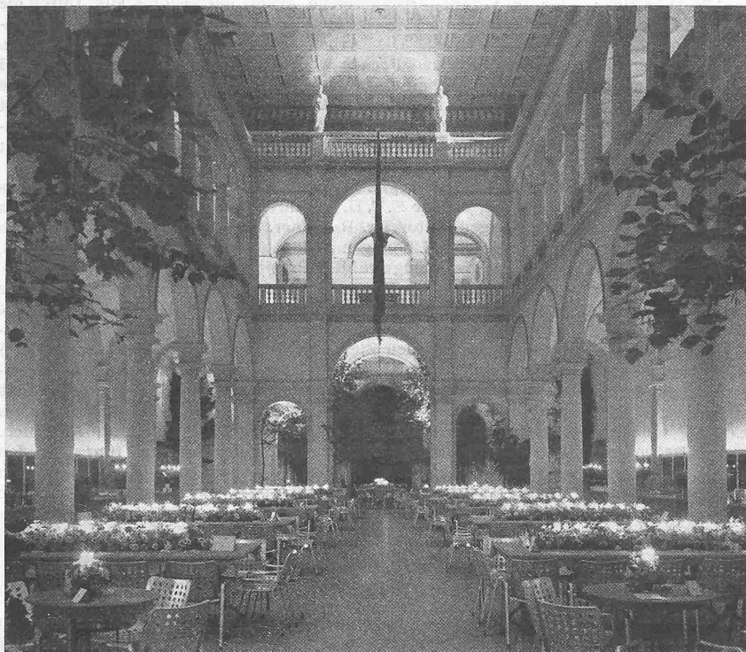
Blick in die Mittelhalle des Hauptgebäudes E.T.H. am Begrüssungsabend der G.E.P. Tische rot gedeckt, stark farbige Herbstblumen, Kerzenlichter; Stühle silbergrau; frische Laubholzbäume. Aus den Obergeschossen farbige Lichtflut

die letzten erst gegen fünf Uhr morgens in guter Ordnung das Feld räumten.