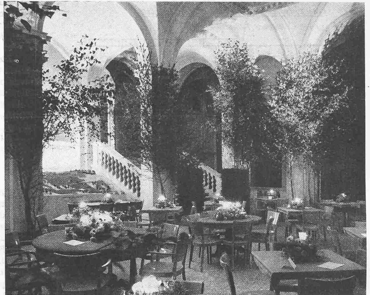
Intime Ecke am Westende der Erdgeschosshalle im Poly am Begrüssungsabend der G. E. P. vom 23. Sept. 1944