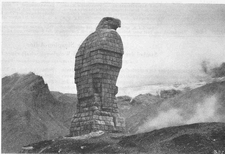
Abb. 2. Der Adler in der Landschaft

[Wie bei der Landesverteidigung fragt man auch beim Bau des Simplonadlers nicht zuerst nach den Kosten, sondern man handelt, erfüllt von der Kraft der Idee. Ein ähnliches Unternehmen, das nicht mit kommerziellen Masstäben gemessen werden darf, ist der «Plan Tanner». Selbstverständlich sind die