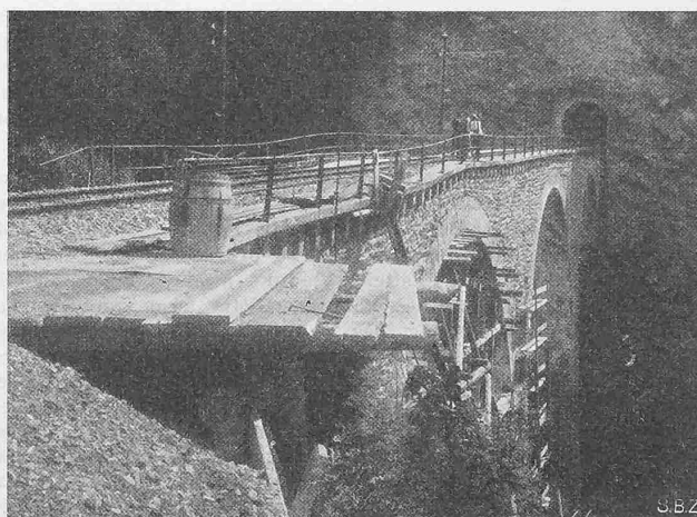
Abb. 2. Zustand zu Beginn der ersten Verstärkungen (1930)