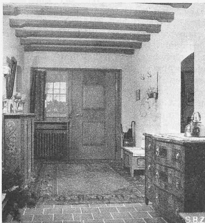
Abb. 3. Die Diele gegen die Haustüre