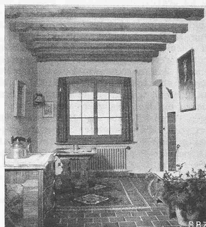
Abb. 5. Blick vom Eingang in die Diele