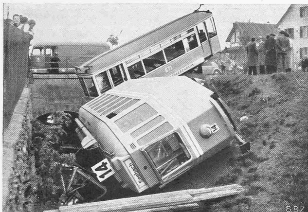
Abb. 5. Umgestürzter Vierachser Nr. 359, samt Anhänger