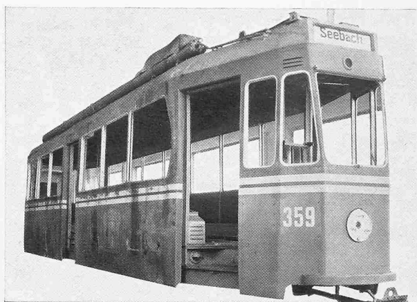
Abb. 6. Seitenwand rechts mit Eindrücken unten und oben vorn