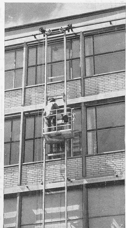
Abb. 4. Fassadendetail und Fensterreinigung