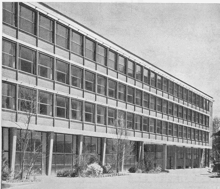
Abb. 3. Teilansicht der Vorderfront.

ohnehin schwierig gewesen, da das Gelände gegen Südwesten ansteigt. Andererseits erleichterte diese Höhendifferenz von etwa 4 m ein unmittelbares Zusammenbauen mit den Fabriktrakten, ohne die Bureauageschosse, die einen ebenerdigen Zugang zum Erdgeschoss von Südwesten her haben, zu beeinträchtigen. Mittels zweier Durchfahrten ist die Verbindung mit den internen Fabrikstrassen hergestellt. Die Südecke des Neubaus steht relativ nahe am Schloss mit seiner grossen, dominierenden Bau-