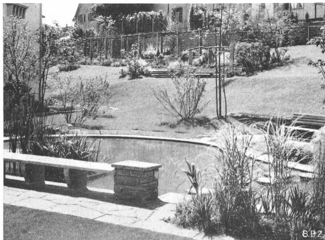
Abb. 4. Blick vom Teich gegen die südöstliche Pergola