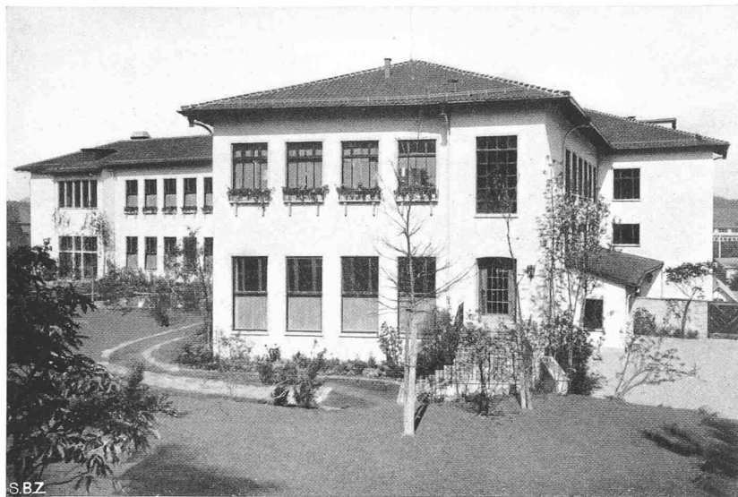
Abb. 2. Gesamtbild aus Südost