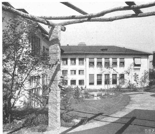
Abb. 3. Wohlfahrtshaus der SWO, Ansicht aus Südwest

An der Hochschule ist eine Vermehrung der Prüfungen zu vermeiden, da diese auf Kosten der akademischen Freiheit den schulmässigen Betrieb begünstigen. Eine Erschwerung der Exa-