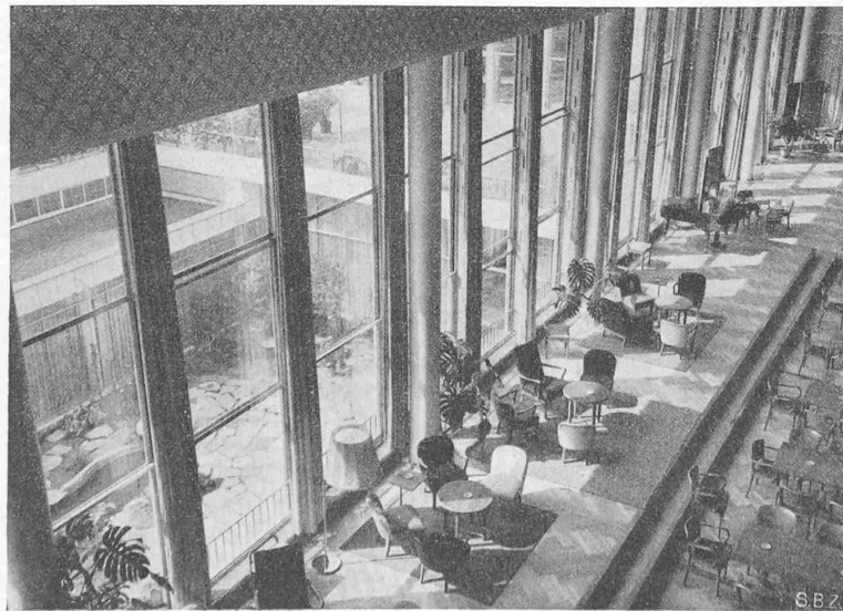
Abb. 28. Konzertfoyer, Estrade entlang der Glaswand. Blick in den Gartenhof. Möblierung aus Stühlen verschiedener Form mit verschiedenen farbigen Ueberzügen

Ideenwettbewerb für ein «Centre municipal d'éducation phys. et de sports» in Genf. Offen für in Genf seit mindestens 1. Jan. 1941 Niedergelassene und für auswärtige Genfer Bürger. Preissumme 40000 Fr., dazu 20000 Fr. für Entschädigungen. Fach-