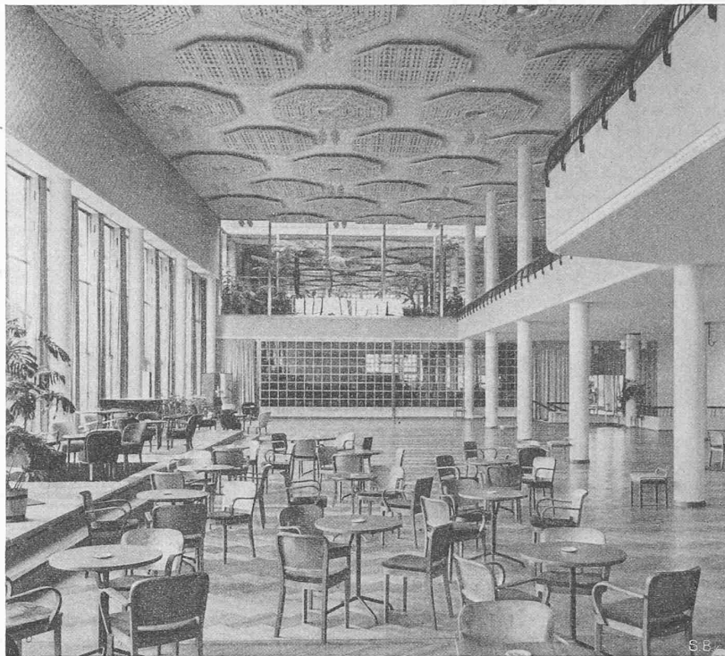
Abb. 27. Konzertfoyer, Blick gegen das Kongressfoyer, mit geschlossener Trennwand. Im Galeriegeschoss tropischer Wintergarten als Trennung