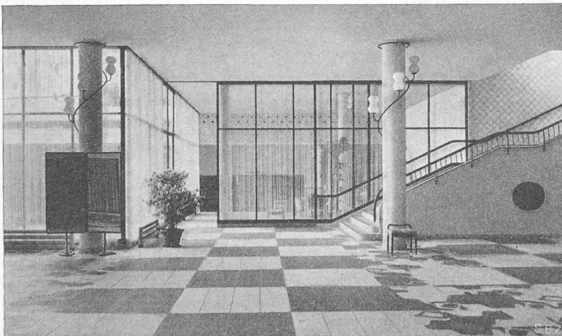
Abb. 25. Kongress-Vestibule mit Treppe zum Kongressfoyer, Durchgang zum Gartensaal, links Gartenhof. Rechts ist die abstrakte Musterung des Bodenbelages sichtbar

Als ein Novum wurde im hohen Norden ein Regulierdamm für 9 m Wasserdruck fast ganz aus Holz gebaut. Wegen des Sommerhochwassers erfolgte der Bau im Winter, was für den Holzbau nicht ungünstig war, besonders da der Holztransport vom Gebirge her zu dieser Jahreszeit