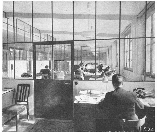
Abb. 19. Die Bureaux der Abonnement-Abteilung

fahrbereit rd. 2000 kg, Radstand 1750 mm, Länge 3200 mm, Breite 1700 mm.