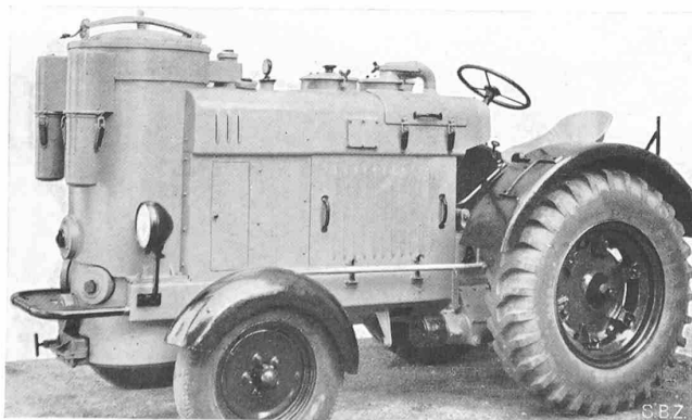
Abb. 1. Der Landwirtschafts-Holzgas-Traktor der SLM

Technische Daten des Traktors: Motorleistung mit Holz- gas 30 PS, Fahrgeschwindigkeit mit Fünfgang-Getriebe vor- wärts 3,7; 6,2; 11,2; 20; 31,5 km/h, v_{max} bei 2500 U/min am Motor 35 km/h, rückwärts 3 km/h, Brennstoffvorrat 40 kg, Gewicht