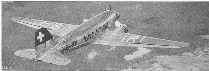
Abb. 2. Douglas DC-3 der «Swissair». Das 1937 meistverwendete Verkehrsflugzeug

minderung von 25 bis 32% und ihren vorzüglichen Laufeigenschaften; an die Fortschritte in der Elektrifikation und im Bau elektrischer Lokomotiven und Triebwagen, an die Schaffung der ersten Gasturbinen-Lokomotive der Welt durch BBC (für 2200 PS), durch die der Wirkungsgrad am Zughaken gegenüber der normalen Dampflokomotive verdoppelt wird (Bd. 119, S. 229* und 241*), u. a. m. Ein für die vorliegende Nummer allzu umfangreicher Artikel hierüber musste zu unserem Bedauern zurückgelegt werden, soll aber demnächst erscheinen. Red.]