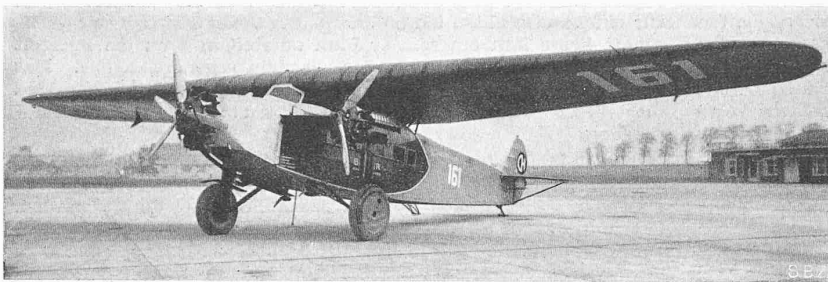
Abb. 1. Fokker F.VII-b3 m, das 1932 meist verwendete Verkehrsflugzeug

durch Eingaben der schweiz. Fachvereinigungen, bei Antritt der Professur für Eisenbahn- und Strassenbau durch den Verfasser darauf gehalten, dass dem Strassenbau auch an der Hochschule vermehrte Aufmerksamkeit geschenkt werden solle. Neben vermehrten Vorlesungen und Uebungen sollte den Hörern auch Gelegenheit geboten werden zu strassenbautechnischen Uebungen und zur Weiterbildung auch nach vollendetem Studium für diejenigen unter ihnen, die sich auf diesem Gebiete zu spezialisieren gedachten. Diese Forderung führte zwangsläufig zur Angliederung eines Lehr- und Forschungsinstituts an den Lehrstuhl.