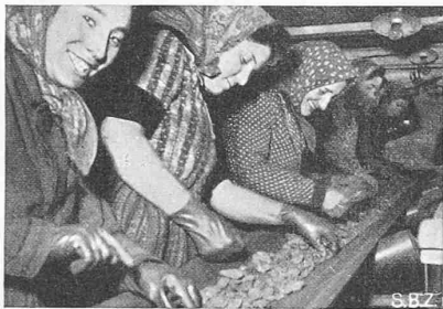
Abb. 5. Ausscheiden von Kohle und Gestein

Von ebenso grosser Bedeutung wie die mengenmässige Steigerung der Produktion ist für unsere Wirtschaft die Verbesserung bzw. die Aufbereitung des Fördergutes.