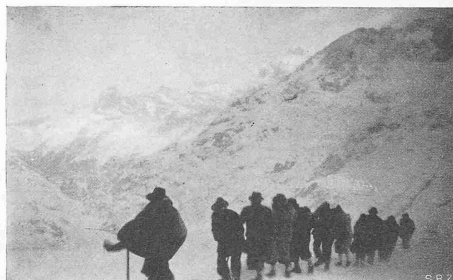
Abb. 1. Anstieg gegen scharfen Wind (an der Spitze Arch. G. Sch.-B.)