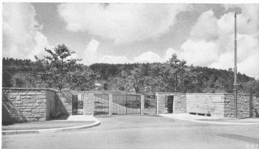
Abb. 2. Der neue Haupteingang zum Friedhof Nordheim, an der Wehntalerstrasse

Bei der Platzwahl der Friedhöfe werden darum landschaftlich hervorragende Gebiete bevorzugt. In der Folge strebt man an, die projektierten Anlagen nicht nur in die nähere und weitere Umgebung bzw. in das Landschaftsbild sorgfältig einzugliedern, sondern mit dem Pflanzenschmuck des Friedhofes das Landschaftsbild noch erheblich zu steigern. Wenn die Friedhofanlage in Verbindung mit einer Kirche steht, wie dies in kleineren Ortschaften meistens der Fall ist, bildet naturgemäss die Kirche das Grundelement der ganzen Anlage. Wo diese Voraussetzung nicht vorhanden ist, muss eine umso sorgfältigere Platzwahl getroffen werden. Ein Aussichtspunkt mit weiträumigen Ausblicken, eine ruhige Umgebung mit allfälliger Anlehnung an einen Wald, die Einbeziehung einer Waldlichtung sind dann die gegebenen Elemente, um einem Friedhof Eigenart und Besonderheit zu verleihen. Bei den Planungen sind vorhandene Geländeüberhöhungen, alter Baumbestand, Teiche, Wasserläufe usw. dazu angetan, den Ausbau reizvoll zu gestalten. Wenn bei Friedhofbauten in bewegtem Gelände Bodenbewegungen nicht zu umgehen sind, sollten diese auf ein Minimum beschränkt werden. Ingenieurbauten, Stützmauern und Ueberbrückungen, starke Einschnitte oder Auffüllungen