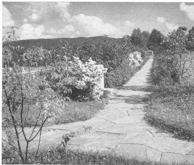
Abb. 3. Plattenweg parallel zum Hang, durch Grünstreifen gesäumt

An sich ist ihr Zweck, der Bestattung zu dienen und hierzu die nötigen Flächen für die Gräber zu liefern, also eine Nutzung. Zugleich werden sie aber heute, veranlasst aus Gründen der Pietät, als Stätten der Ruhe und Erholung aufgefasst und demgemäss weitgehend so gestaltet, dass sie auch als Erholungs- bzw. als Park- und Schmuckanlagen dienen können. Die Absicht geht dahin, die Friedhofgebiete nach Beendigung der Belegung in reine Parkanlagen umzuwandeln und sie dann als unantastbares Allgemeingut auf die Dauer zu erhalten. Es sei in diesem Zusammenhang daran erinnert, dass der Grosse Stadtrat im Anschluss an die Aufstellung des Bebauungsplanes für das dama-