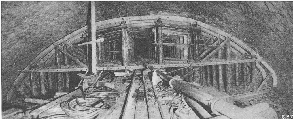
Abb. 32. Gerüst für die Gewölbebetonierung der grossen Kaverne von 19,5 m Lichtweite