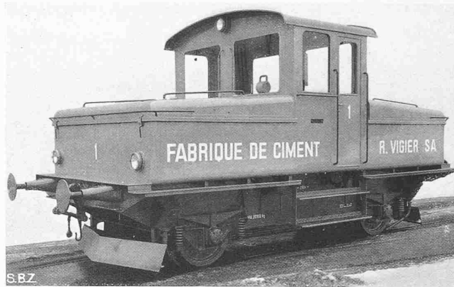
Abb. 1. Oerlikon-Akkumulatoren-Lokomotive von 100 PS

Die solchen Triebfahrzeugen gelegentlich vorgeworfenen hohen Unterhaltskosten betreffen stets die Batterie, und zwar nur solche Fälle, wo diese überlastet, unsachgemäss behandelt, oder schon von Anfang an zu knapp bemessen wurde. Bei richtig bemessenen und gepflegten Batterien wurde in der Tat bei vielen dieser Fahrzeuge eine Lebensdauer von durchschnittlich etwa 8 Jahren für die positiven und etwa 15 Jahren für die negativen Platten beobachtet; diese Lebensdauer wird aber heute, auf Grund der inzwischen gemachten Fortschritte der Technik, für normale Verhältnisse noch höher ausfallen.