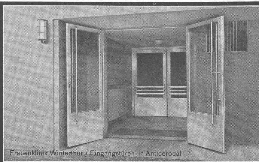
Frauenklinik Winterthur / Eingangstüren in Anticorodal

GEILINGER & CO. Eisenbau-Werkstätten WINTERTHUR