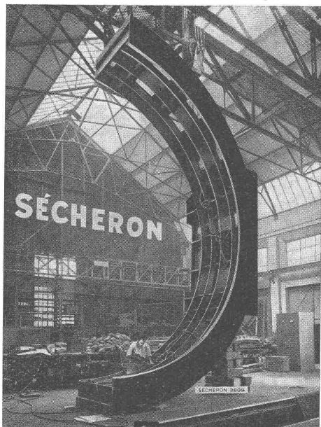
Geschweisste Statorhälfte von 7,60 m Durchmesser für einen 27 500 kVA-Generator.