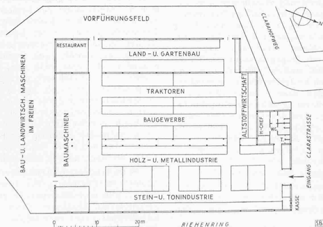
Provisorische Erweiterung für die Baumesse

Die Jubiläums-Messe will aber nicht nur der grosse schweizerische Verkaufsmarkt sein, sondern zugleich auch schweizerische National-Ausstellung. Sie will als Musterschau dem Messebesucher Markterlebnis im besten Sinne des Wortes werden. Sie will Zeugnis ablegen von der achtunggebietenden Leistungskraft des Schweizervolkes. Sie will zu neuem Leistungswillen anspornen und zur nationalen Leistungsgemeinschaft aufmuntern. Hoffnungsfreudig lenkt sie unser Aller Blicke aus dieser sorgenschweren Gegenwart in die bessere Zukunft, indem sie in den Hallen und an den Messeständen zur Verkünderin der national-wirtschaftlichen Grundwahrheit wird, dass sich unser freies und unabhängiges Land in einem neuen Europa und in einer neu aufgebauten Welt wirtschaftlich nur dann wird behaupten können, wenn es auch weiterhin qualitative Höchstleistungen vollbringt.