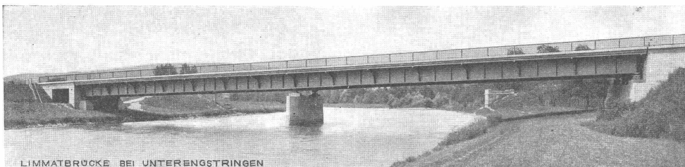
LIMMATBRÜCKE BEI UNTERENGSTRINGEN