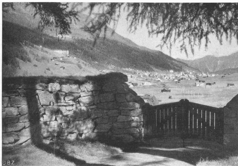
Abb. 22. Davos. Friedhofsmauer und schlichtes Holztor, ein Beispiel landschaftsverbundener Bauweise

Die neuen, im Entstehen begriffenen Stadtteile frassen sich da, wo die Bodengestaltung es leicht machte, in die Landschaft hinein und zerstörten rücksichtslos, was die Natur vorher geschaffen hatte. Wenn wir heute trotz grosser Fehler, die die Stadtplanung während der zweiten Hälfte des letzten Jahrhunderts beging, noch gewisse Naturschönheiten im Innern der Städte besitzen, so ist das nicht dem Empfinden der damaligen Stadtplaner zu danken, sondern es hängt nur mit der Schwierigkeit der Erschliessung ungünstiger Geländeformen