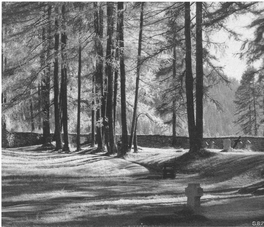
Abb. 21. Trockenmauer, mit Rasenziegeln abgedeckt, im Waldfriedhof Davos, Arch. R. GABEREL

Bestrebungen landschaftsverbundenen Bauens werden zunichte gemacht, sobald die Gräberfelder in die hergerichteten Grünflächen hineinzuwachsen beginnen und die kleinen «Schubladen» mit den Nummern ihre Steine und ihre Begonien erhalten. Aus diesem Grunde sind die hier gezeigten Bilder wohl in Bezug auf ihre Gesamtanlage und Beziehung zur Landschaft ansprechend, ihre gute Wirkung aber wird trotz allerlei Vorschriften über Denkmalgestaltung und Grabschmuck mit der Zeit illusorisch. Das wird nicht besser werden, bevor wir uns entschliessen können, das Einzelgrab nicht als Individuum möglichst kostbar auszugestalten, sondern uns zur vollen Anerkennung der Landschaft bereit erklären, der wir uns wirklich unter- und einordnen wollen.