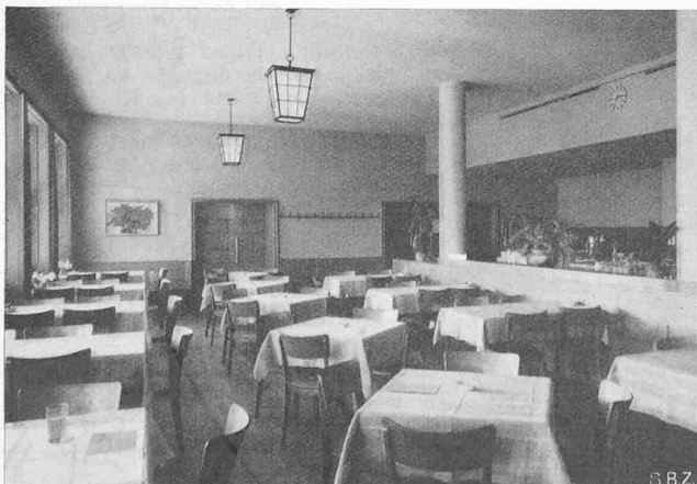
Abb. 9. Die Wirstube, rechts das Buffet