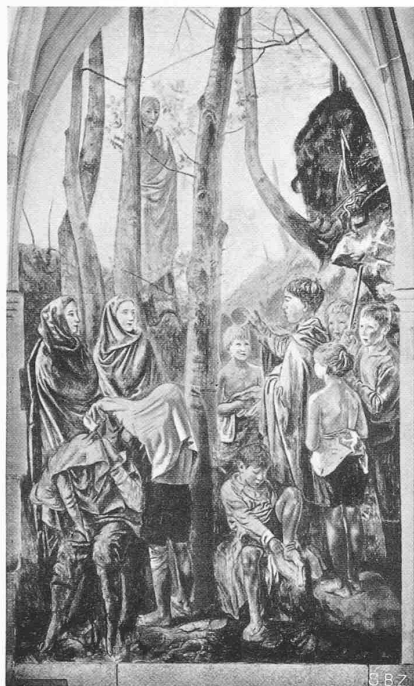
Abb. 1. Taufe der Kinder Felix und Regula