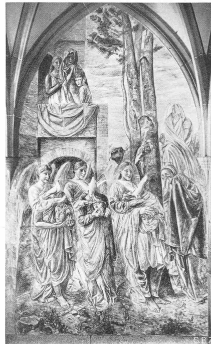
Abb. 3. Die enthaupteten Märtyrer