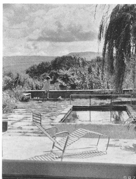
Abb. 9. Fernsicht auf die Jurahöhen