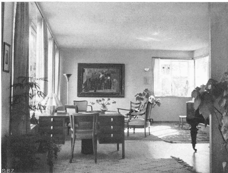
Abb. 10. Das Wohnzimmer im Hause Hermann Baur, Basel