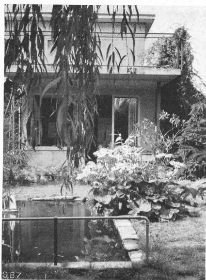
Abb. 8. Blick vom Sandplatz