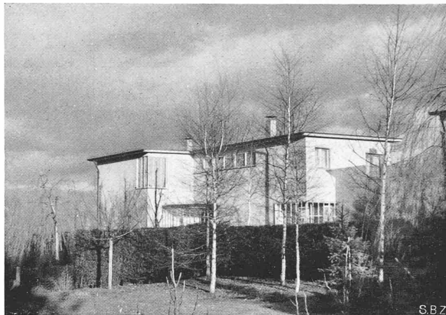
Abb. 5. Winterbild aus Westen, mit dem Schatten des Nachbarhauses