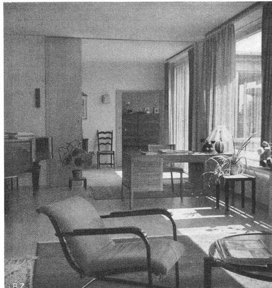
Abb. 11. Durchblick gegen das Esszimmer

schinen auf etwa 6 Mio Kilowatt und die jährliche Erzeugung auf rd. 20 Mia kWh gesteigert werden können. Das zeigt unzweideutig, dass sogar die Gesamtleistung aller unserer bestehenden und ausbauwürdigen Wasserkraftanlagen bei vollständiger Elektrifizierung der Heizeinrichtungen bei weitem nicht für die Deckung unseres heutigen Bedarfes ausreichen würde. Zudem wäre es unmöglich, den künftigen Mehrbedarf an hochwertiger motorischer und Lichtenergie durch unsere Wasserkraftanlagen zu decken.