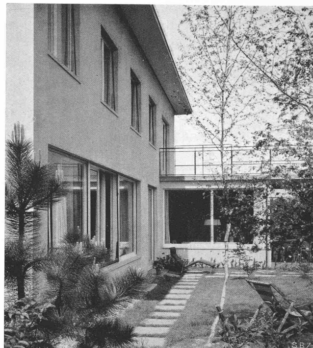
Abb. 7. Streifbild aus Südwest gegen die Veranda

Der Eis- und Gletscherforschung bieten sich heute, dank der Fortschritte der angewandten Physik, sowie der auf den verschiedensten Gebieten erfolgten Vervollkommenung der Untersuchungsmethodik, ganz neue Möglichkeiten. Als erfolgversprechende Methoden seien in Ergänzung der bisherigen Ausführungen erwähnt: die Bestimmung der Gletscherdicke durch seismische und Funkmutung [19], die Stereophotogrammetrie, die