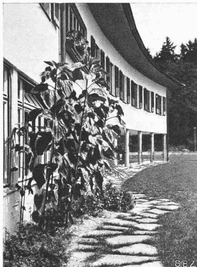
Abb. 18. Ende des Zöglingsflügels