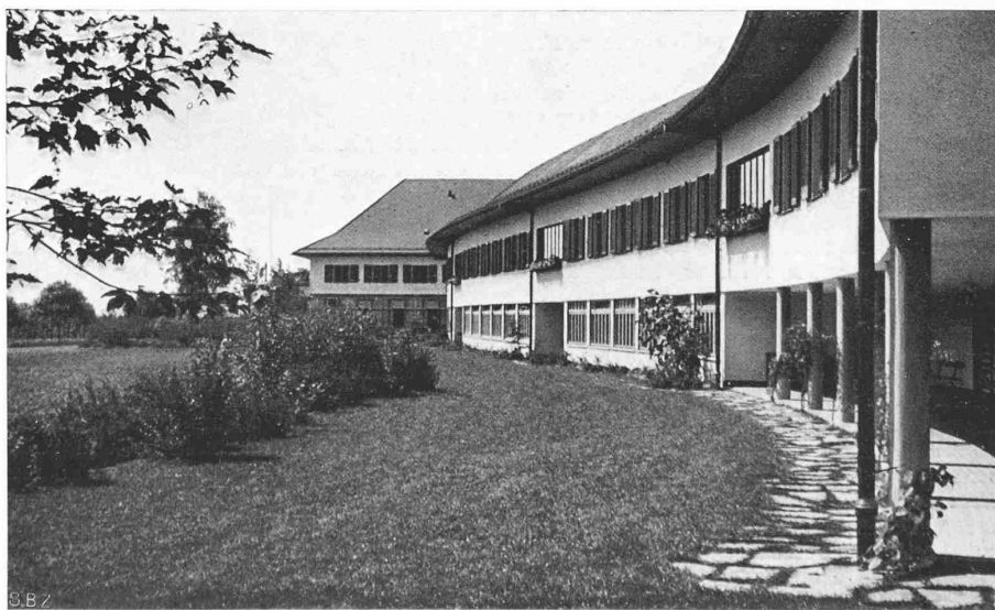
Abb. 20. Blick vom Ende des Zöglingsflügels gegen den Hauptbau im Westen

Die Gründung des Verbandes fällt in eine Zeit, da der Bund, d. h. die eidgenössischen Behörden bemüht waren, das nicht ganz ohne ihre Schuld etwas verwilderte schweizerische Eisenbahnwesen zu ordnen und zu regeln. Begreiflicherweise standen die sehr auf ihre Unabhängigkeit bedachten Bahngesellschaften