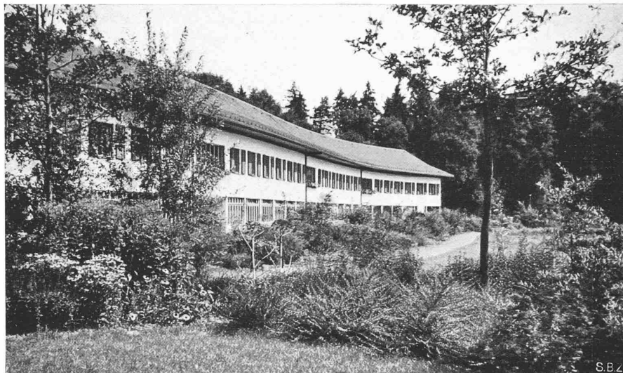
Abb. 19. Zöglingsflügel gegen das östliche Ende, Südfront

wundervollen Erdenfleck. — Die in Holz konstruierten landwirtschaftlichen Schuppen dienen zur Haltung von Kleinvieh, wie Hühner, Schafe, Schweine, Kaninchen usw., um die Abfälle rationell verwerten zu können. Neben diesen Ställen ist ein Geräte- und Heuschopf errichtet. Die Einrichtungen der Hühner- und Schweinestallungen sind nach den heutigen Empfehlungen unserer landwirtschaftlichen Schulen errichtet worden.