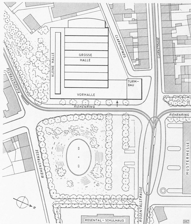
Lageplan 1: 2500 von Platz und neuer Halle, rechts der Kopfbau der bestehenden Mustermesse-Hallen in Basel

Die Betrachtung der dritten Bezugsgrösse, des versteuerten Einkommens, zeigt für beide Energiearten einen ganz gleichartigen, sehr charakteristischen Verlauf. Zwischen 1500 und 3600 Fr. Einkommen bleibt der tatsächliche Energieverbrauch ziemlich unverändert. Dies hängt zweifellos vor allem damit zusammen, dass die Abnehmer mit den kleinsten Einkommen doch einen