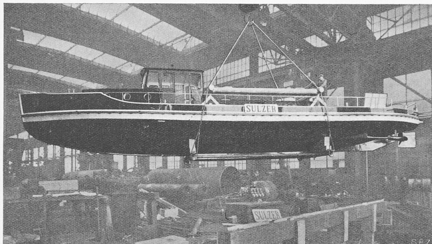
Abb. 1. Das Basler Feuerlöschboot «Sankt Florian» in der Werkstätte von Gebr. Sulzer, Winterthur