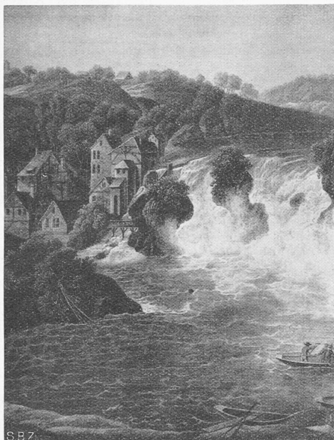
Abb. 2. Die alten Mühlen am Rheinfall