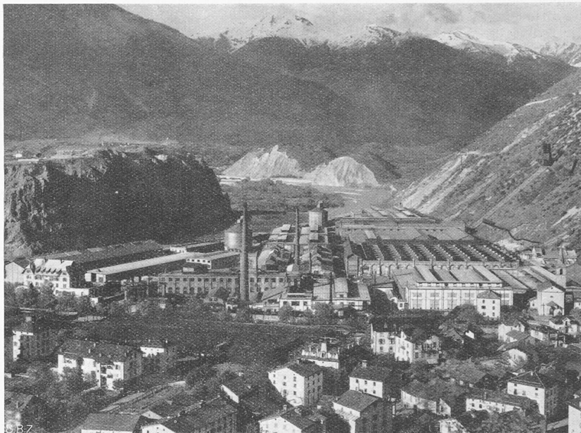
Abb. 3. Aluminium-Hüttenwerk Chippis der A. I. A. G., im heutigen Umfang

Metall liegenden Möglichkeiten berät und ihn von Fehlverwendungen abhält. Nur wenn die Verwendung von Aluminium an Stelle bisher gewohnter Werkstoffe einen technischen oder wirtschaftlichen Vorteil mit sich bringt, ist es möglich, einen Dauererfolg zu erzielen. Auf Augenblickserfolgen kann kein Weltabsatz aufgebaut werden.