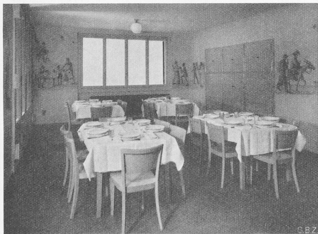
Abb. 6. Esszimmer, links Glastüren gegen Turnveranda

Der Dachraum, der nicht ausgebaut ist, kann durch eine Zugtreppe im Vorplatz der Hauselternwohnung betreten werden.