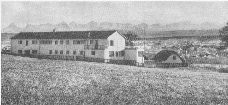
Abb. 3. Heilanstalt Biberist aus Norden, Blick auf die Alpen

Ein geräumiger Windfang, mit Garderoben versehen, trennt die Bureaux der Beratungsstelle (Wartezimmer, Fürsorgerin, Arzt) vom internen Betrieb des Heimes. Das Bureau des Hausvaters hat sowohl Verbindung mit dem Windfang, wie mit dem Innern des Heimes. Die Kinder besitzen einen eigenen Zugang von der Südseite, dessen Windfang zugleich als Kindergarderobe ausgebaut ist. Die Tagräume, wie Werkstatt, Schulzimmer, Spielzimmer, Esszimmer, sind mit grossen Fensterflächen und niedrigen Brüstungen versehen. Die dem Esszimmer vorgelagerte Veranda, dreiseitig mit Schiebefenstern verglast, wird als Spielraum, Liegehalle und Turnlokal verwendet. Alle diese Räume sind hell und lebhaft in der farbigen Gestaltung. Direkte Ausgänge aus dem Esszimmer und aus der Veranda auf die mit Natursteinplatten belegte Gartenterrasse vermitteln neben dem Kindereingang die Verbindung mit dem Garten. Das Kind soll nirgends das Gefühl haben, in einer Anstalt eingesperrt und stets beobachtet zu sein. Bei der Ausgestaltung aller Räume, wie auch der ganzen internen Organisation wurde auf dieses Moment grosses Gewicht gelegt. So wurde versucht, jede Andeutung von Anstaltscharakter zu vermeiden, sowohl in der Organisation wie in der baulichen Gestaltung. Die Küche, sehr gross bemessen, ist vollständig elektrisch eingerichtet.