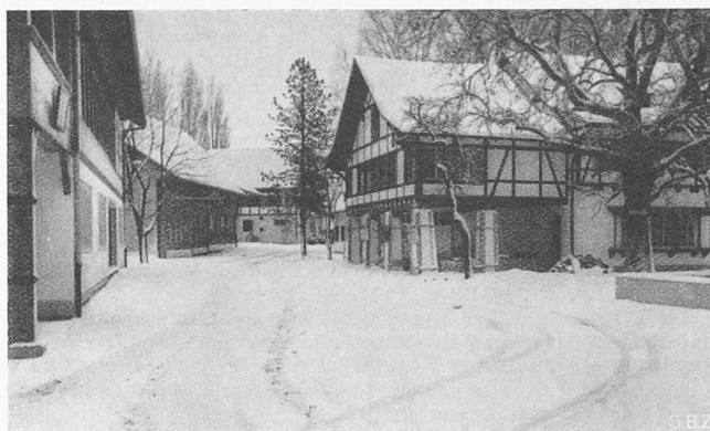
Abb. 4. Im Dörfli, gegen Osten