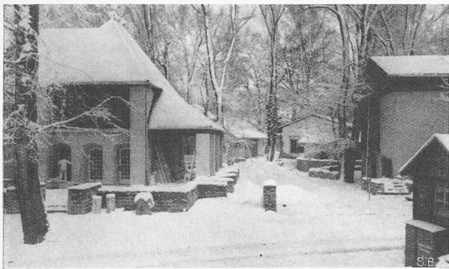
Abb. 3. Blick ins welsche Pintenquartier