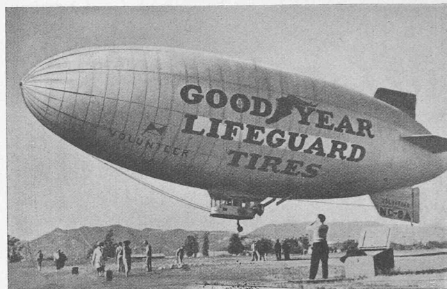
Abb. 8. Eines der sieben Goodyear-Luftschiffe, die in Akron (Ohio) und Los Angeles in Dienst stehen für Passagierfahrten und Reklame. Auch werden sie 1939 an den Weltausstellungen von San Francisco und

New York gebraucht. Länge 42 m, Inhalt 3150 m 3 . 2 × 110 PS, v = 100 km/h. Aktionsradius 720 km, 4 Fahrgäste