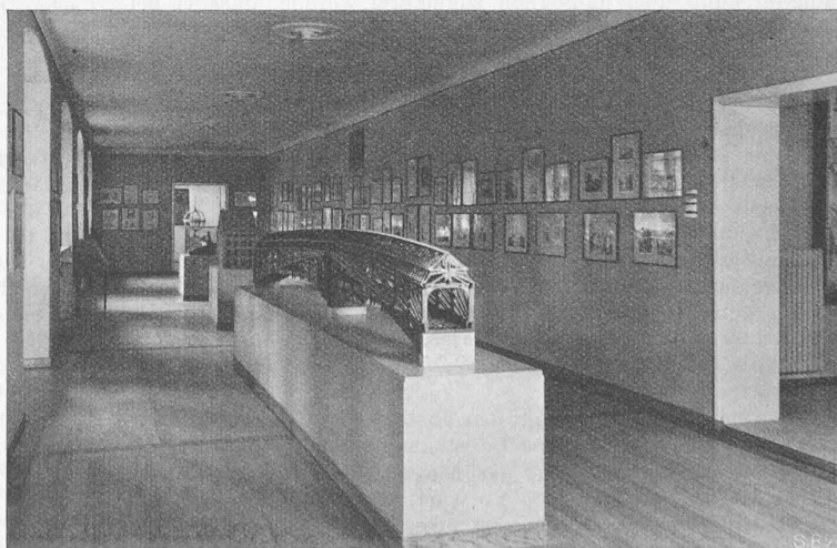
Abb. 34. Stadtgeschichte in Bildern, Modell der Grubenmannschen Rheinbrücke

Als Schlussfolgerungen seiner Ausführungen hat der Vortragende folgende Wünsche zusammengefasst: 1. Mehr Zusammenarbeit zwischen Unternehmer und Bauleiter auf loyalen Basis.