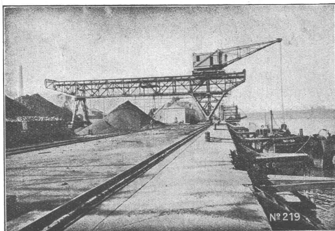
Verladeanlage im Hafen von Bilbao.