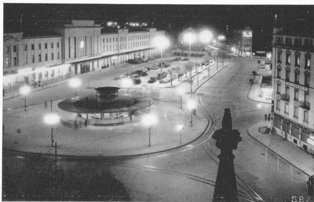
Abb. 1 (links) Der neue Bahnhofplatz Genf-Cornavin (ebenfalls mit runder Warthalle) beleuchtet mit Philips-«Philora»-Quecksilberdampflampen H O 2000, gemischt mit 1500 Watt-Glühlampen

Wie im Plan des erweiterten Bellevueplatzes Seite 13 dieses Heftes angedeutet, wird die vor 55 Jahren erbaute Quaibrücke den heutigen Verkehrsanforderungen entsprechend verbreitert. Obige Abb. 1 und 2 geben den nötigen Aufschluss in Ansicht und Schnitt; in diesem sind die beibehaltenen alten Teile dünn gehalten bzw. im Schnitt der Fahrbahnplatte weiss gelassen, während die neuen Teile, vor allem die beiden auf die abgetragenen Pfeilervorköpfe abgestützten Blechträger mit gebogenem Untergut kräftig gezeichnet und die Schnittflächen schraffiert sind. Wie man sieht, erfolgt die beidseitige Verbreiterung symmetrisch zur Brückenachse; die Pfeiler werden von den dekorativen Kandelaber-Aufbauten befreit und auch das schmucklose Geländer trägt zur Erleichterung des Aspektes bei. Die formale Gestaltung durch die Arch. Gebr. Pfister bestätigt also im wesentlichen die vor kurzem im «Seeufer-Wettbewerb» im 1. und 2. Rang prämierten Vorschläge (Entwürfe Nr. 15 und Nr. 21, vgl. Bd. 110, S. 243* ff.). In konstruktiver Hinsicht dagegen weicht das heutige Bauprojekt wesentlich ab von dem, was im Wettbewerb massgebend war. Dort war den Bewerbern erklärt worden, die Pfeilerfundamente seien nicht stark genug,