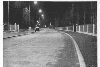
Abb. 2 (rechts) Zürichseestrasse bei Meilen mit «Philora»-Natrium- dampflampen SO 650