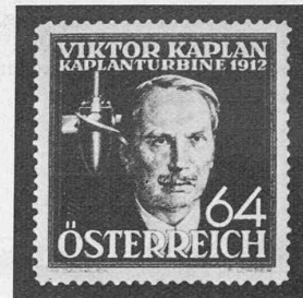
Abb. 2 (rechts). Oesterreichische Kaplan-Briefmarke (1936)

Escher Wyss, Charmilles, Voith, Laufraddurchmesser 7,0 m — Wettingen, 1933, Escher Wyss, verhältnismässig hohes Gefälle 23 m — Marne, Italien, 1935, Charmilles, Gefälle 31,6 m — Vargön, Schweden, Karlstads Mekaniska Werkstad, das grösste Kaplantaufrad der Welt, Durchmesser 8,0 m.