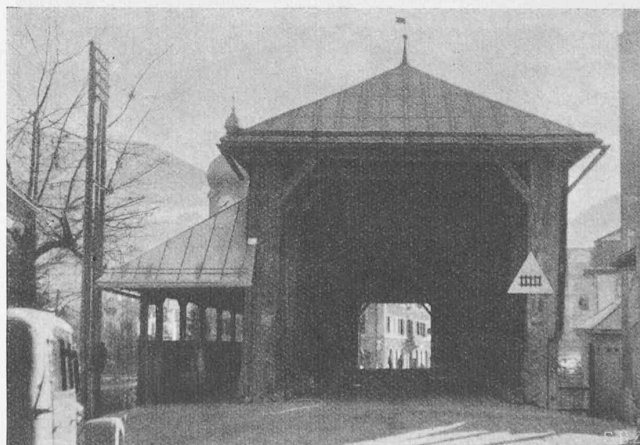
Abb. 2. Durchblick mit flussabwärts angebautem Gehsteg