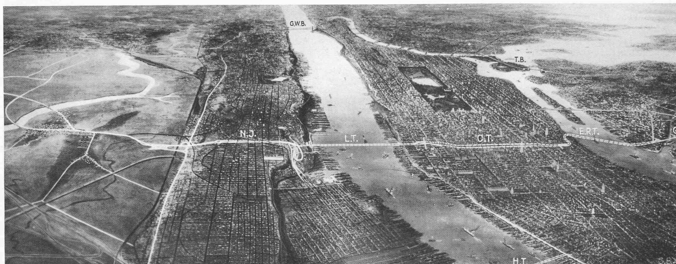
Abb. 2. Flugbild aus SW auf New Jersey, Manhattan und Queens (Q) mit Lincoln-Tunnel, Crosstown-Tunnel und East River-Tunnel nach Queens. Im Hintergrund George Washington-Brücke, im East River Triborough-Brücke; ganz vorn der Holland-Tunnel. Der auf dem Bilde sichtbare Hudson-Fluss vom Holland-Tunnel bis zur G. W.-Brücke hat ungefähr die Ausdehnung des Wallensees (vergl. Abb. 1)