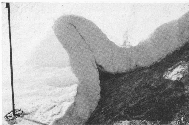
Abb. 2. Querschnitt einer Schneefalte auf grasbedecktem Boden (Bildung in mehreren Tagen)

rd. 10 kg/PS, bei modernen Auto-Dieselmotoren sogar nur 5 kg/PS. Für den Flugmotor ist auch dies noch zu viel; er verlangt, um zu fliegen, 0,5 kg/PS! Die Frage, ob der hochentwickelte Benzin-Flugmotor durch einen überlegenen Oelmotor zu verdrängen sei, ist noch nicht entschieden. Der Wunsch, den Kolben-Verbrennungsmotor durch eine rotierende Verbrennungsturbine zu ersetzen, ist alt und unerfüllt. Einstweilen beschäftigt der Gedanke einer Zwischenlösung unternehmende Ingenieure: die Freiflugkolbenmaschine, vielleicht bekannter unter andern Namen, sei es als Pescara-, sei es als Junkersmotor.