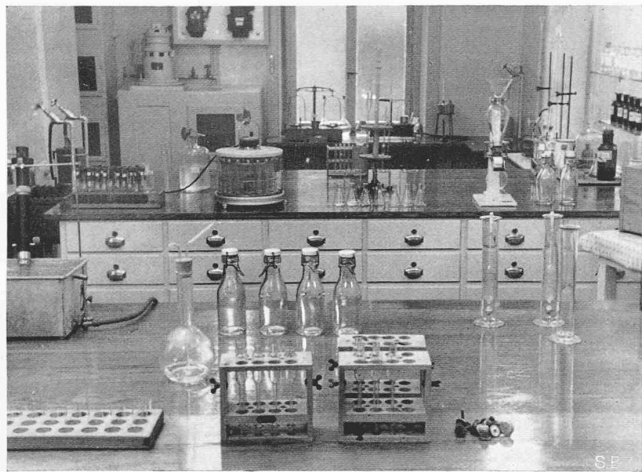
Abb. 1. Allgemeines Laboratorium mit Arbeitsplätzen im Milchtechnischen Institut der E. T. H.