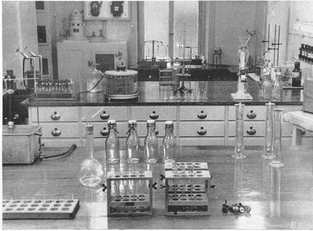
Abb. 1. Allgemeines Laboratorium mit Arbeitsplätzen im Milchtechnischen Institut der E. T. H.