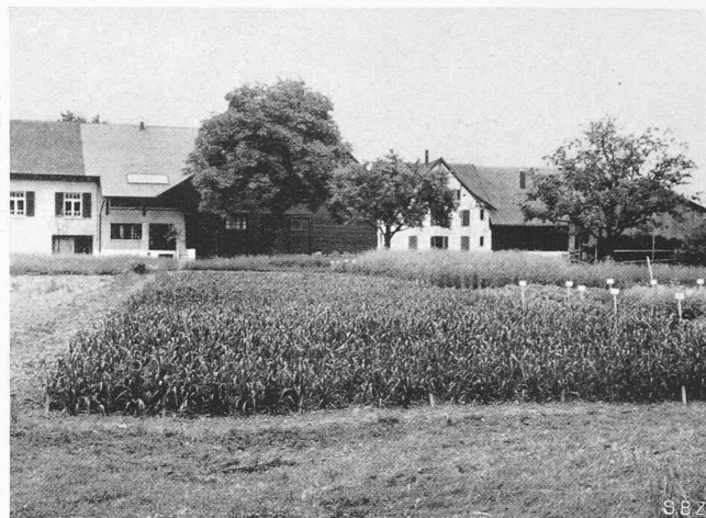
Abb. 2. Lehrgut Rossberg, Roggen-Getreide Zuchtfeld

Mit der Uebernahme der Dozentur für Tierproduktionslehre an der Abteilung für Landwirtschaft der E. T. H. im Sommer 1929 durch den gegenwärtigen Ordinarius fand gleichzeitig eine Ergänzung der bisherigen mehr empirisch-praktischen Lehreinstellung nach der wissenschaftlich-experimentellen Seite hin statt. Diese Umstellung setzte zunächst die Schaffung gewisser Forschungsmöglichkeiten voraus. Das Fehlen eines neuzeitlich ausgestatteten wissenschaftlich-technischen Tierzuchtinstitutes stand zu der rasch vorwärtsschreitenden und hochstehenden schweizerischen Züchtungspraxis in einem bemerkenswerten Gegensatz. In einem ausgesprochenen Züchterlande, wie die Schweiz es ist, wo die Züchtung zusehends immer mehr zur qualifizierten Präzisionsarbeit wurde, musste ein solcher Mangel auf die Dauer für Wissenschaft und Praxis nachteilig in Erscheinung treten. Als angewandte Wissenschaft besitzt die Züchtungslehre der Haustiere im Gegensatz zu den reinen Wissenschaften in hohem Masse einen nationalen Charakter, weshalb gerade diese Disziplin ohne den Unterbau einer bodenständigen landeseigenen Forschung ihren Zweck mit der Zeit nicht mehr hätte erfüllen können. — Die tatkräftige Unterstützung des derzeitigen Präsidenten des Schweizerischen Schulrates ermöglichte die Einrichtung eines provisorischen Tierzuchtinstitutes an der E. T. H. Zürich im Jahre 1930. Im Keller-geschoss des Nordwestflügels des land- und forstwirtschaftlichen Gebäudes wurden zunächst vier kleinere Räume proviso-