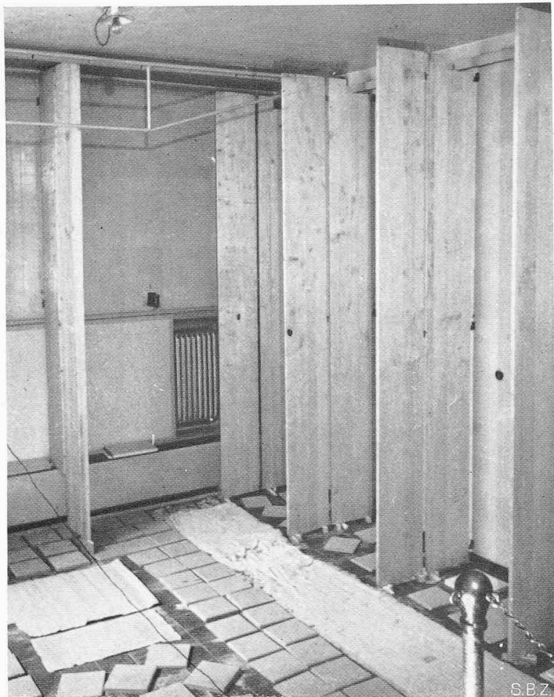
Abb. 4. Vertikale Vollmasstab-Holzkassetten im Hallraum

Plan des Hallraumes, der, akustisch geeicht, das Hauptrequisit eines Laboratoriums zur Erforschung von Schallschluck- und Schalldämmeigenschaften von Baumaterialien ist. Hier werden auch die Messgeräte geeicht. U. a. wurden eingehende Versuche über die Schallzustände in vollmasstäblichen Holzkassetten angestellt, Abb. 4 bis 6, die zeigen, wie ausserordentlich kompliziert die Schallverteilung mit der Tonhöhe sich verändert, selbst in so kleinen und einfachen Taschen, wie Kassettenfächern 1) . Diese Bilder sprechen eine ernste Warnung aus, dass der Experimentator die Eigenheiten des Schallfeldes und die Messanwendbarkeit der Instrumente ergründen muss, wenn er nicht Gefahr laufen will, aus willkürlichen Einzelmessungen Fehlschlüsse zu ziehen, und diese möglicherweise noch extrapoliert oder verallgemeinert. Glücklicherweise reagiert das Ohr nicht so scharf auf Unhomogenitäten im Messfeld wie es das exakte Instrument tut, aber solche Untersuchungen geben einen lebendigen Einblick in das komplizierte Leben der Naturphänomene und lassen Schlüsse zu auf die Weitergestaltung von Kassettengebilden. — Abb. 7 u. 8 sind zwei Beispiele von neuen, praktischen, aus dem Institut hervorgegangenen akustischen Lösungen: ein Wasserschleier zur Einsperrung des Lärms einer Turbine im Auslaufkanal, und die Dämpfung der Planetarien, die heute allgemein nach diesem Prinzip gemacht wird.