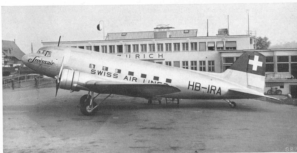
Abb. 9. 21-plätziger Douglas DC3 der «Swissair». 2 × 1000 PS, Reisegeschwindigkeit bis 290 km/h