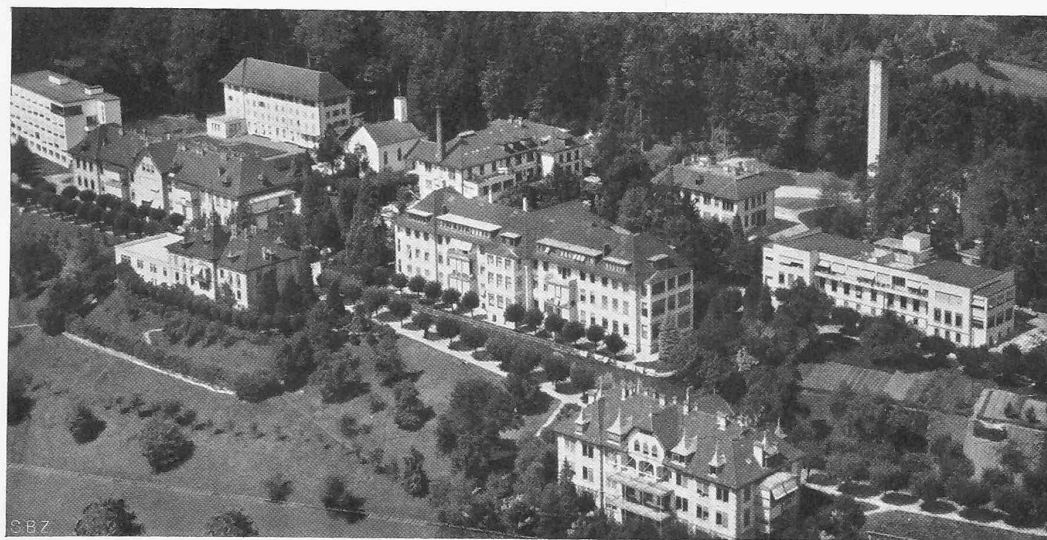
Abb. 2. Flugbild des westlichen Teiles (von Medizin 2 bis Chirurgie 2) vor der Aufstockung von Medizin 3.