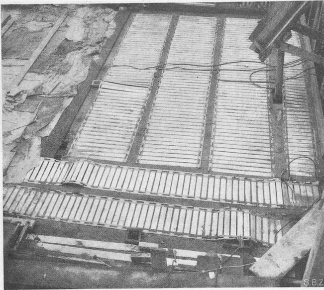
Abb. 7. Elektrodenteppiche beim «Hirse»-Bau, Zürich.

erreicht, und auch dem uralten Jerusalem gliedern sich in rastloser Ausdehnung neue Stadtteile an, zumal seitdem vor kurzem das grossartige Bauwerk der neuen Wasserleitung von Ras-el-Ain nach Jerusalem vollendet wurde, die das Trinkwasser aus den Quellen des Jarkon-Flusses auf einer Strecke von rund 80 km über 900 m hoch zu den Trinkwasser-Reservoirs der auf dem Kamm des Gebirges Jehuda liegenden «Heiligen Stadt» emporhebt.