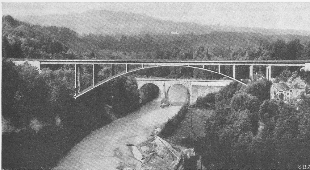
Abb. 15. Die Wirkung einer konstruktiv richtig gestalteten Stabbogenbrücke im Landschaftsbild.