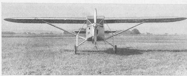
Abb. 5. Frontansicht des Reiseflugzeuges W. F. 21, Flugzeugbau Grenchen.