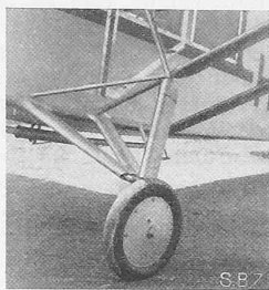
Abb. 4. Fahrwerk.