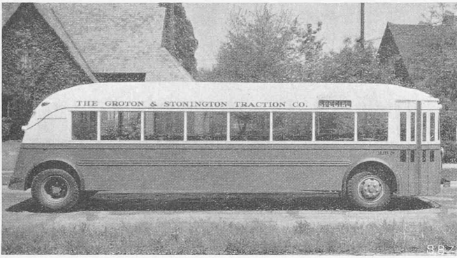
Abb. 5. Twin-Coach, 37 Sitzplätze, Heckmotor, Einsteighöhe 70 cm.